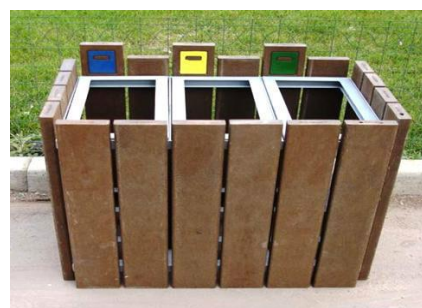
CAIXOTES DE RECICLAGEM