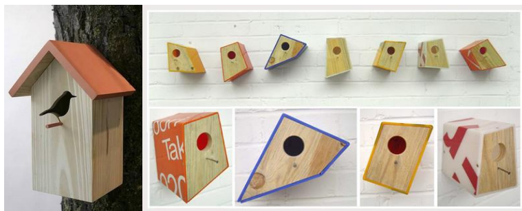
CASAS PARA PÁSSAROS